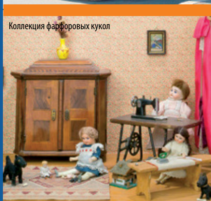
Коллекция фарфоровых кукол