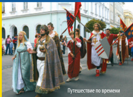
Путешествие по времени