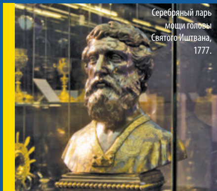
Серебряный ларь мощи головы Святого Иштвана, 1777.