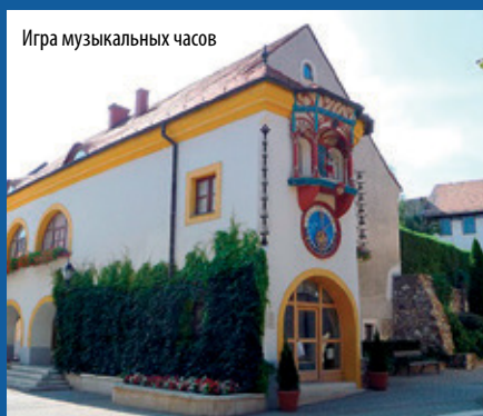
Игра музыкальных часов

Совсем недалеко от центра города отдыхающий найдет прохладу тенистых рощ и прудов, но и здесь есть достопримечательности -- и музыкальный павильон (20), построенный на тысячелетие Венгрии, и музыкальный колодец с лечебной водой. В садовом пригороде находится затопленный водой карьер,