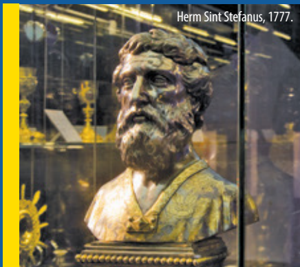
Herm Sint Stefanus, 1777.